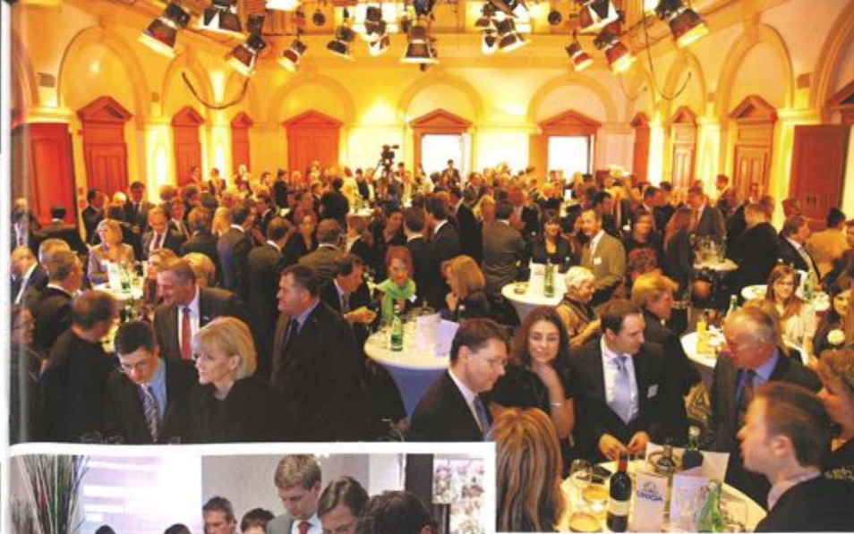
Großes Foto links: Ausgezeichnete und Auszeichnende ließen sich bei der Festveranstaltung zu Recht feiern.