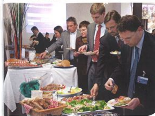
Foto oben: Fast die gesamte Branche fand den Weg in den Marx-Palast im dritten Wiener Gemeindebezirk.